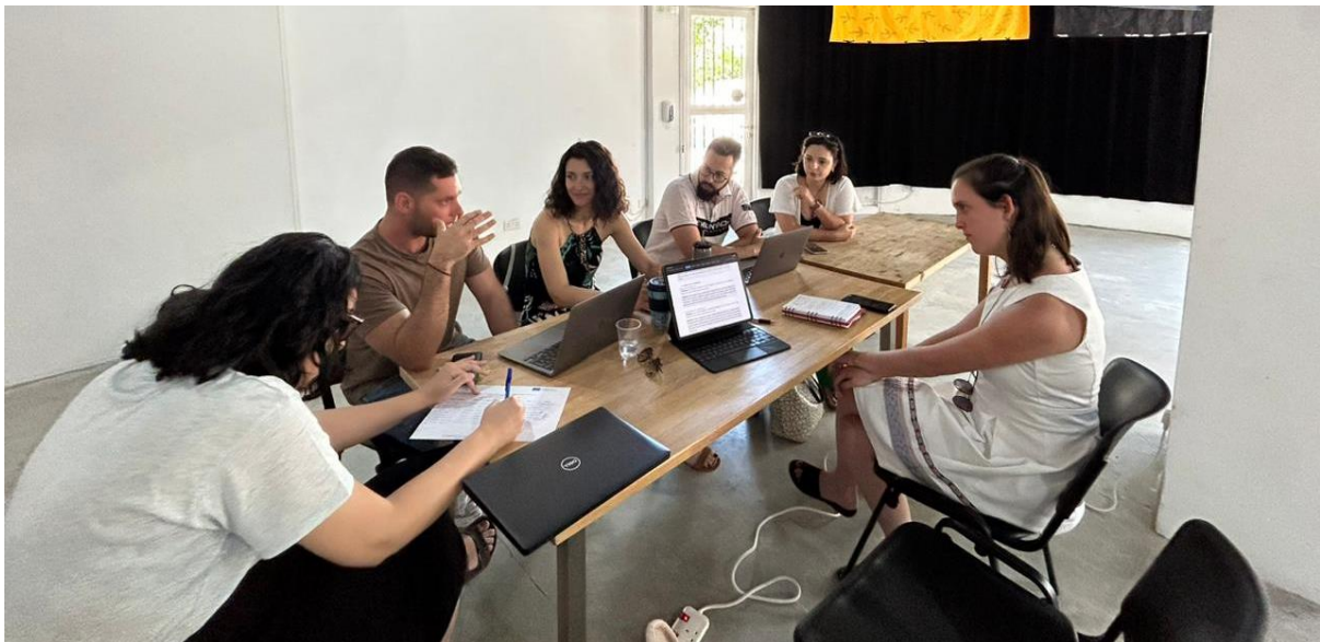
Εικόνα 1: Μέλη της ομάδας εστίασης συζητούν κατά τη διάρκεια της διά ζώσης συνάντησης της δραστηριότητας

Μετά την εισαγωγική φάση ακολούθησε η συζήτηση της ομάδας εστίασης. Αρχικά, η συζήτηση αφορούσε το περιεχόμενο του εκπαιδευτικού και συγκεκριμένα το εάν θα έπρεπε αυτό να επικεντρωθεί σε μικρομεσαίες επιχειρήσεις, μεγάλες εταιρείες ή και τις δύο κατηγορίες. Μετά από μία ενδελεχή ανταλλαγή ιδεών και απόψεων από τους συμμετέχοντες, διαφάνηκε η έντονη ανάγκη που υπάρχει για την ενσωμάτωση στρατηγικών Περιβαλλοντικής, Κοινωνικής και Εταιρικής Διακυβέρνησης (ΠΚΔ) σε μικρομεσαίες επιχειρήσεις. Η έμφαση για την εφαρμογή στοιχείων ΠΚΔ είχε παρουσιαστεί ως ένα μέσο για την ενίσχυση της ανταγωνιστικότητας των επιχειρήσεων αυτών στην αγορά και της δυνατότητας τους να ξεχωρίσουν από τον ανταγωνισμό.